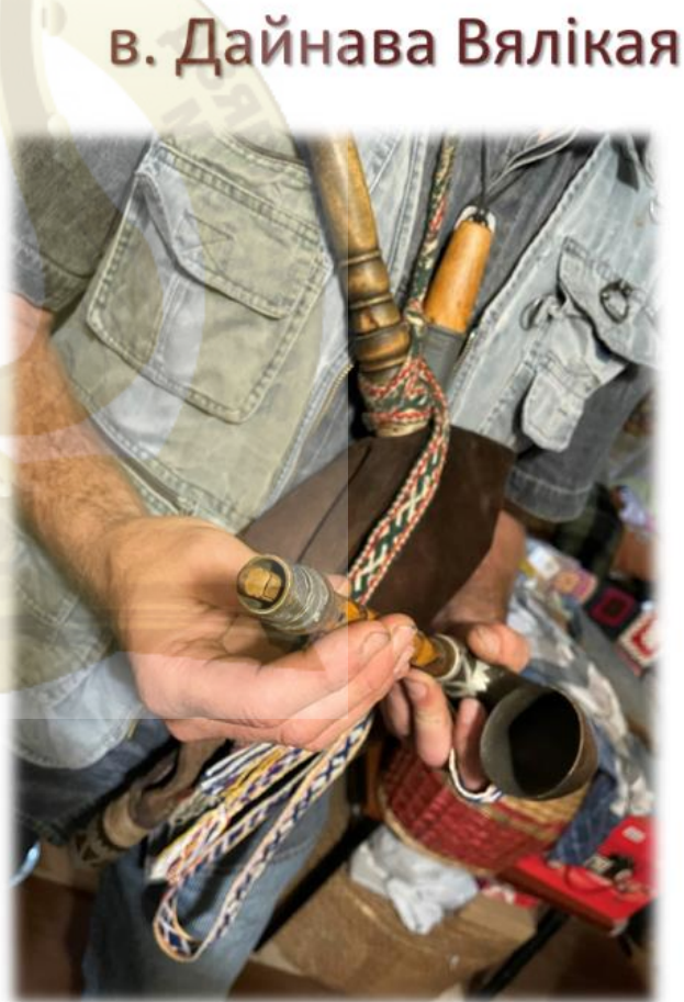
Пішчык у «піраборы»