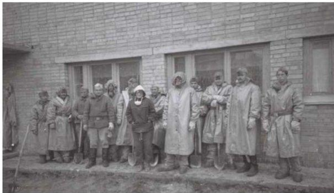
«Дезактивационные работы Припяти. 1986-87 гг.»